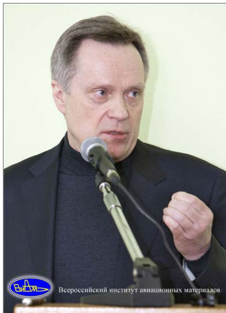
Всероссийский институт авиационных материалов

Напомним, что основная область научных интересов Виктора Кожевникова – изучение дефектной структуры, высокотемпературной термодинамики и явлений переноса в сложных оксидах переходных металлов.